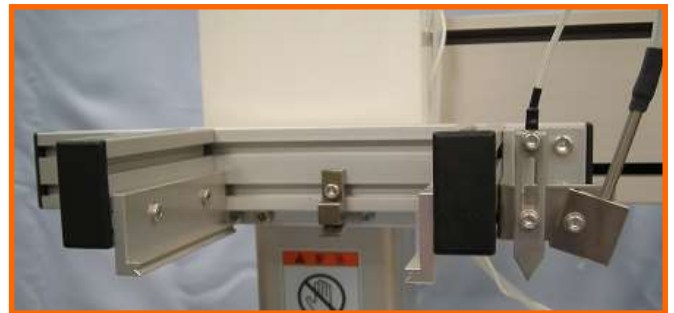
基板ハンガー部／半田供給部／液面検知部／カスカキ機構部